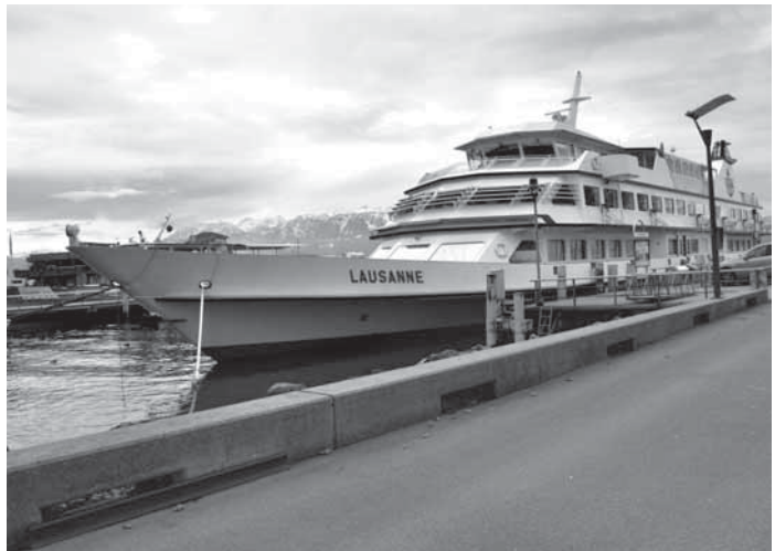
" Le Lausanne" Ancré à la jetée d'Osches

Organisé sur le bateau " Le Lausanne", ce brunch réunira de nombreux participants et acteurs du Salon Immobilier de Lausanne et du Forum Immobilier Romand ainsi que des secteurs de l'immobilier, de la finance, et de l'économie.